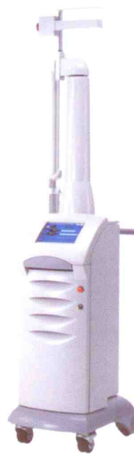
UltraPulse Encore firmy Lumenis